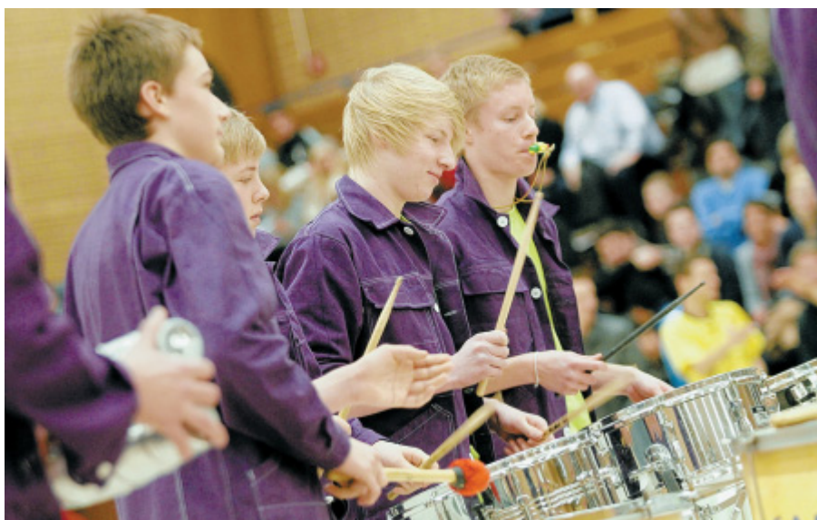
Samba-Rhythmen aus Brasilien: Die Trommler der Percussion-Band „Drum Vampires“ heizen dem Publikum mächtig ein.