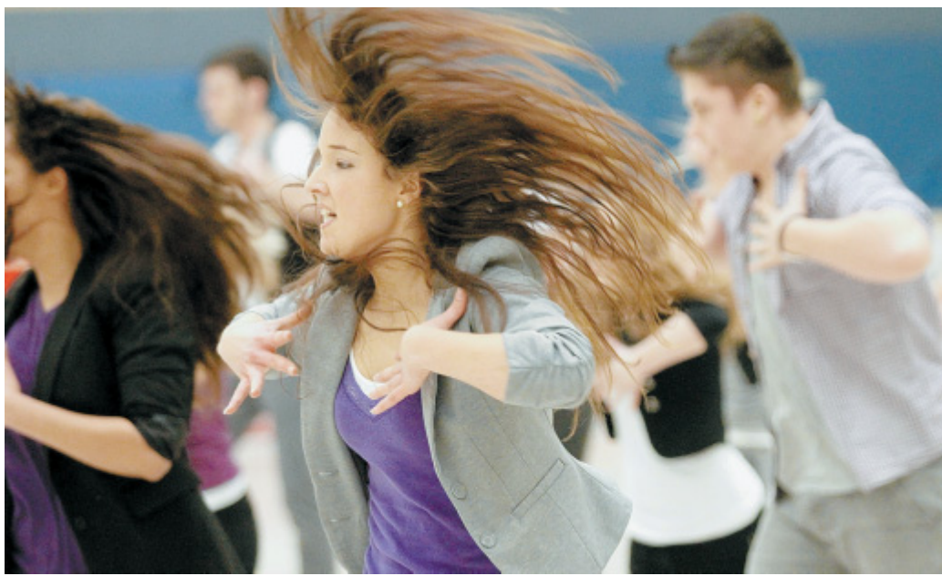
Dynamisch und graziös: Da fliegen die Haare wie ein Kunstwerk durch die Luft. Die Hip Hopper der TG Werste begeistern mit ihren Darbietungen die vielen Zuschauer.