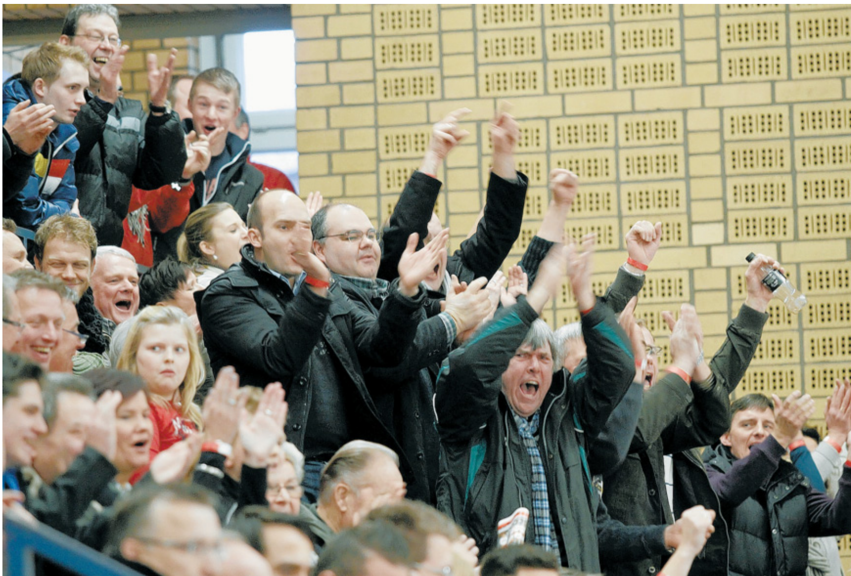
Stimmungskanonen in der Eidinghausener Sporthalle: Der Anhang von A-Ligist TuS Volmerdingsen sorgte für prächtige Stimmung auf der Tribüne.